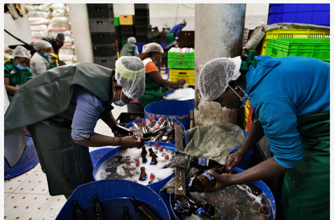
Bottle Logistics East Africa, impresa di trasformazione dei rifiuti di vetro, e' una delle aziende sostenute dall'acceleratore E4Impact

Il progetto rappresenta un'iniziativa pilota nel campo del partenariato tra il mondo accademico, il settore privato e le istituzioni pubbliche (approccio triple helix) per promuovere l'imprenditorialità e la creazione di posti di lavoro in Kenya.